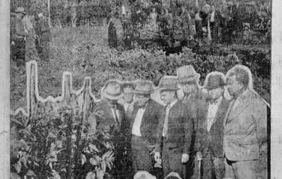
Uno de los tractores Farmall haciendo demostraciones en terrenos de la fábrica de aceites vegetales de Alajuela, en la parte superior del grabado; centro: el secretario de fomento y otras personas observan plantas oleaginosas cultivadas en esos terrenos; abajo: uno de los tractores John Deere que también hizo demostraciones.